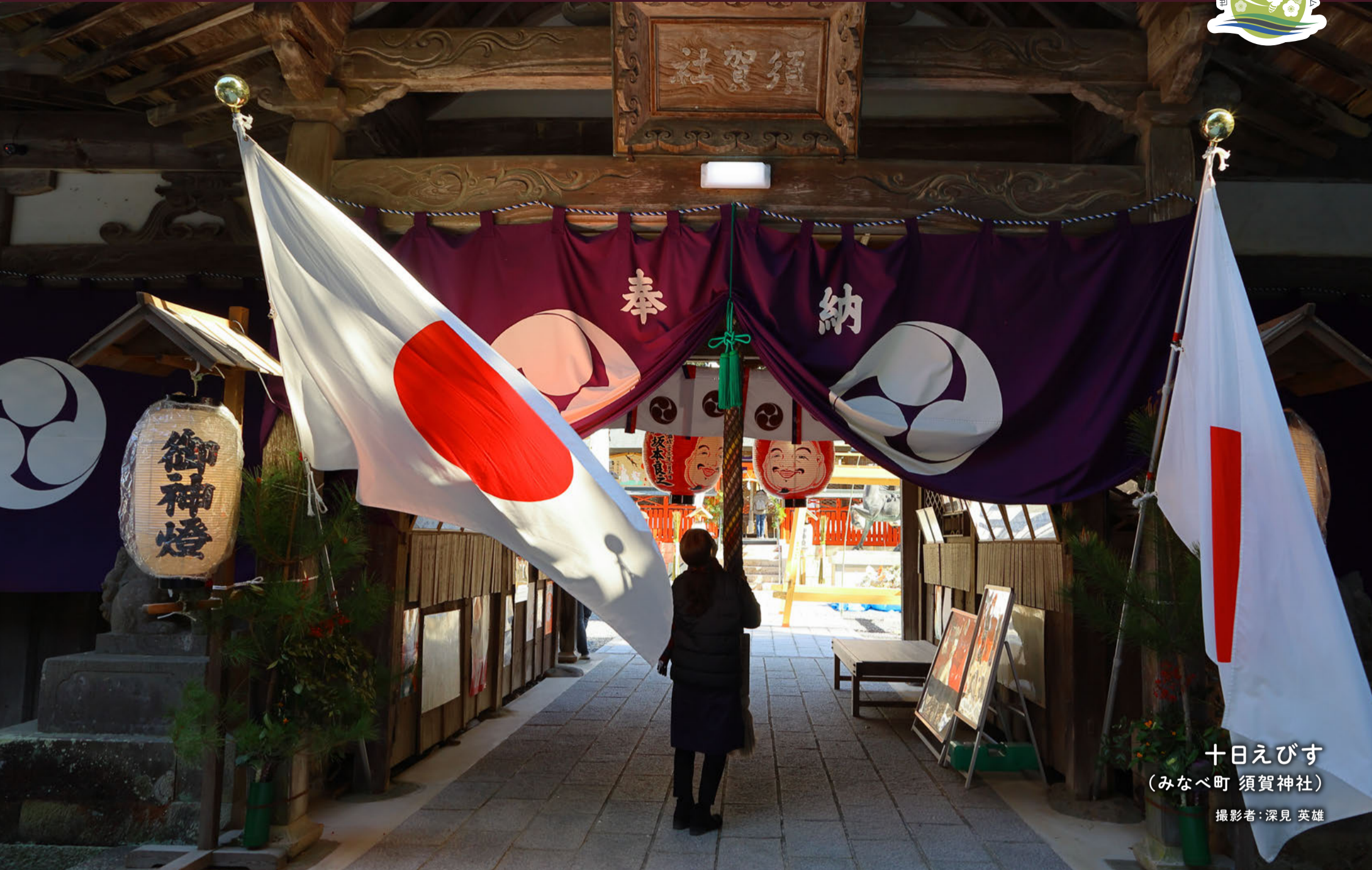
十日えびす (みなべ町 須賀神社)