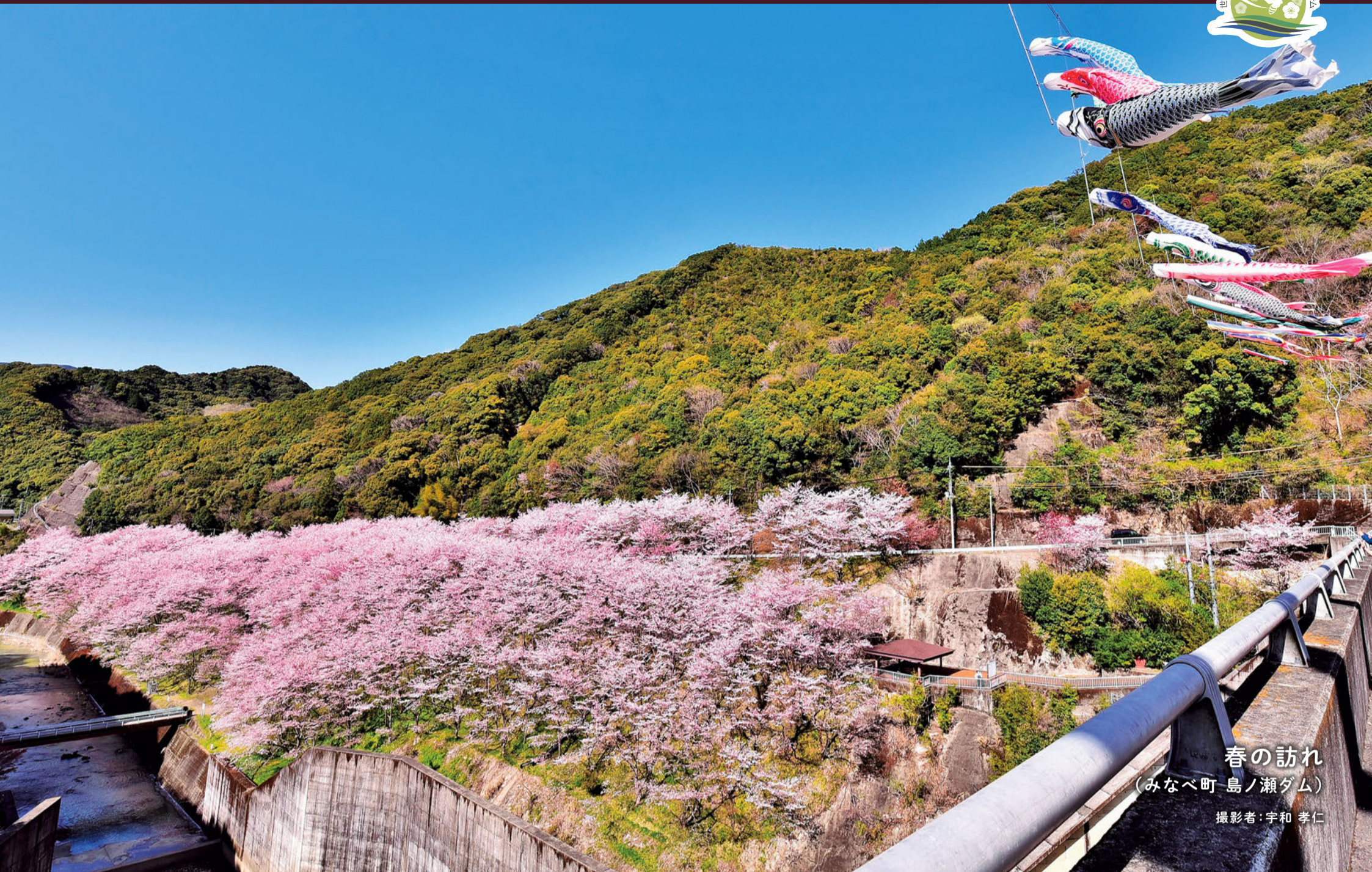
春の訪れ (みなべ町島ノ瀬ダム)