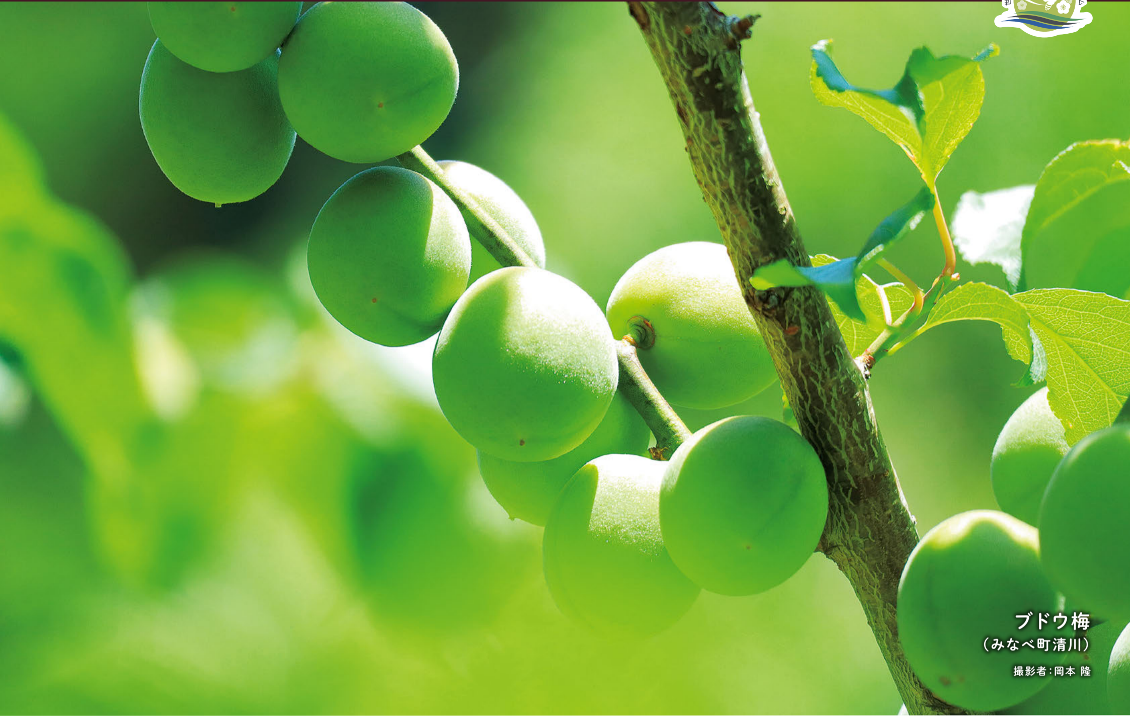
ブドウ梅 (みなべ町清川)