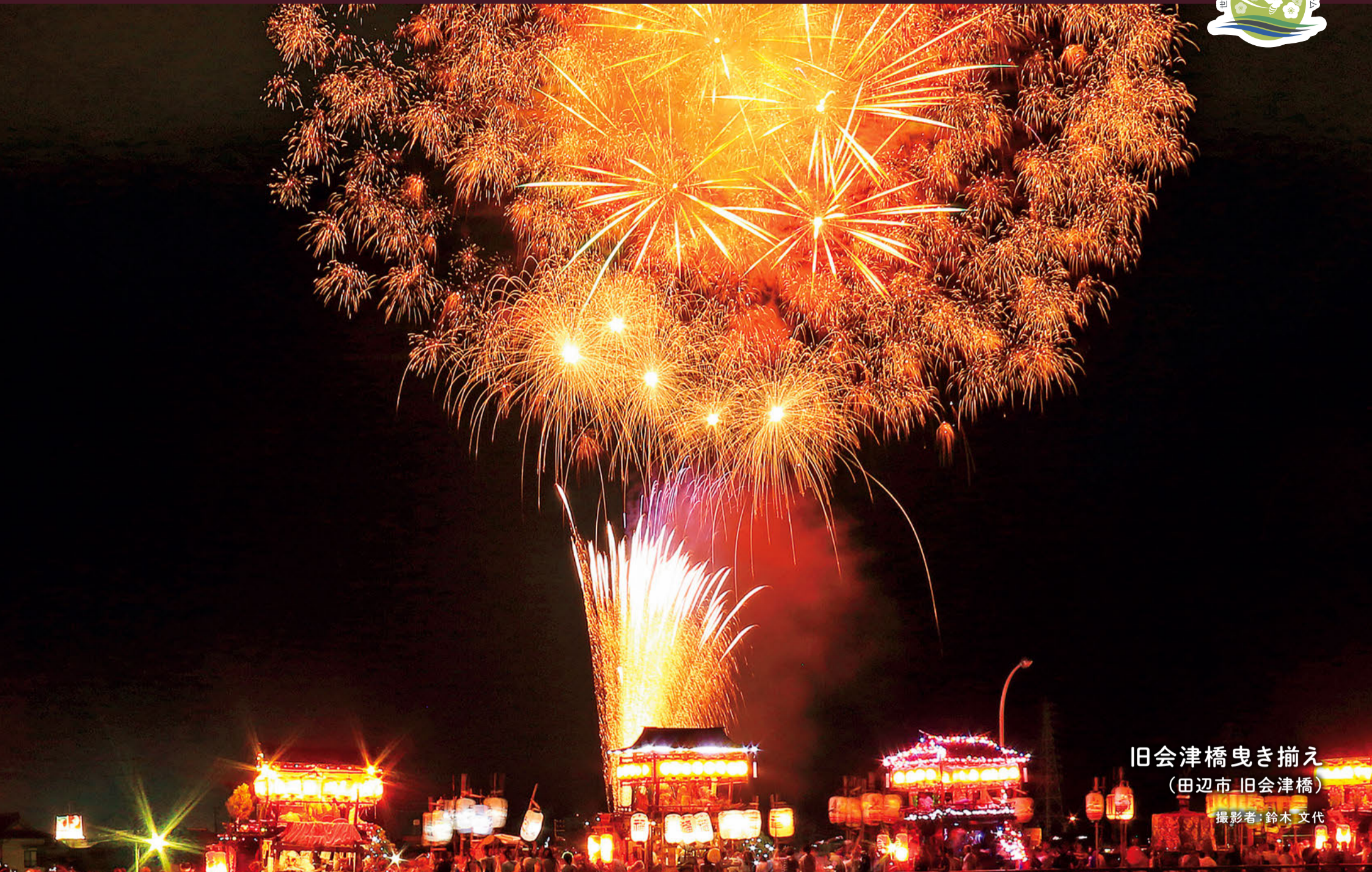
旧会津橋曳き揃え (田辺市 旧会津橋)