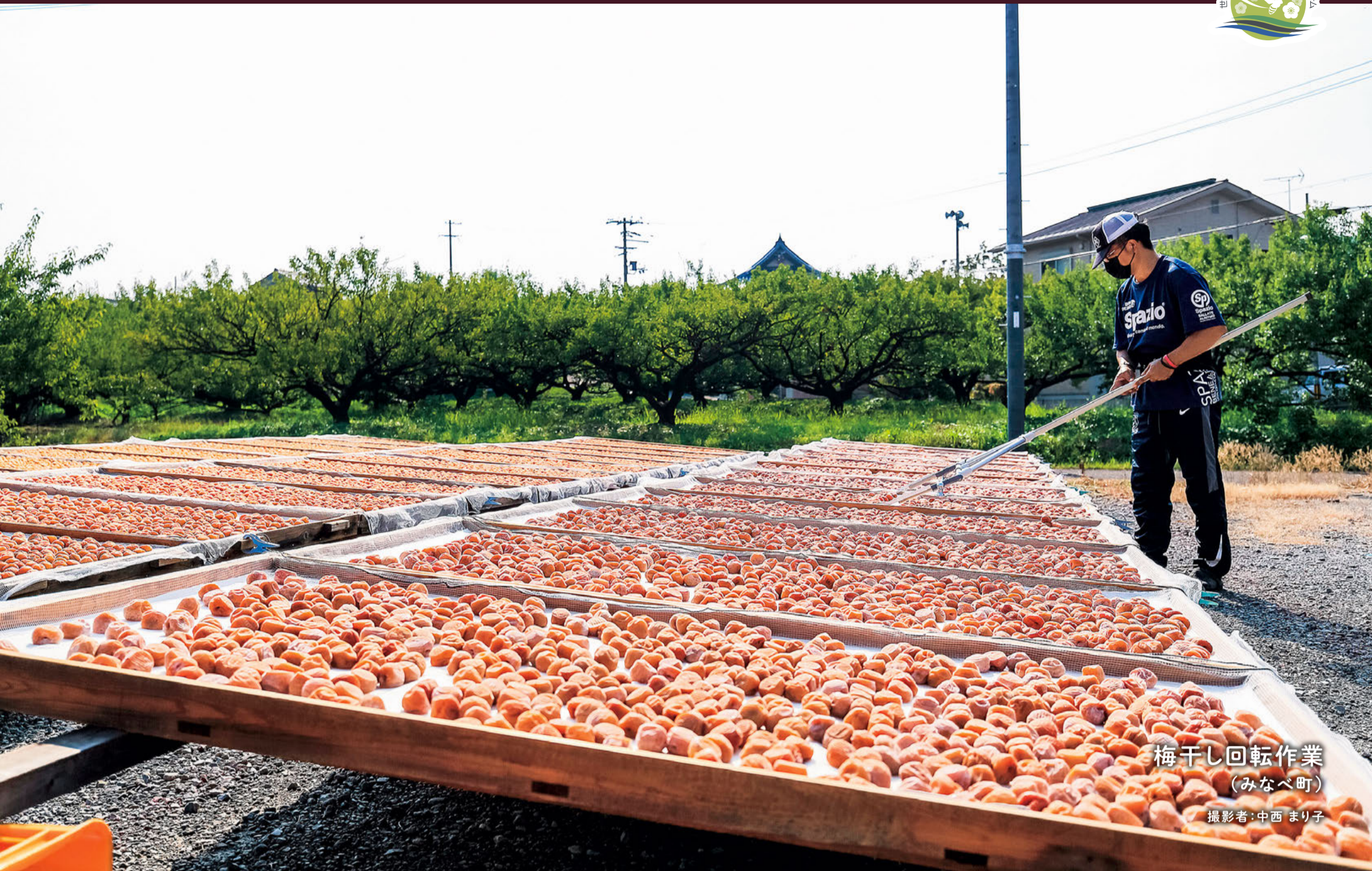
梅干し回転作業 (みなべ町)