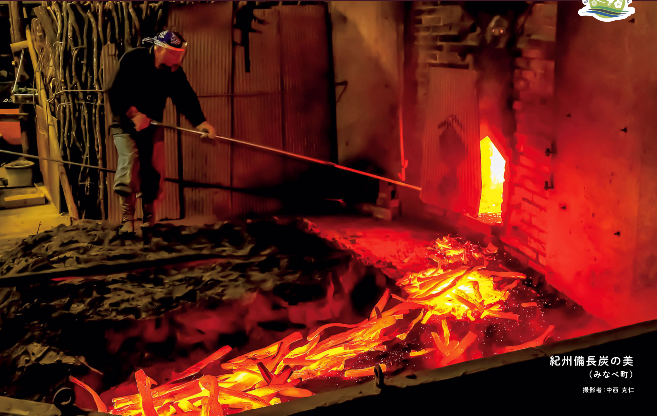
紀州備長炭の美 (みなべ町)