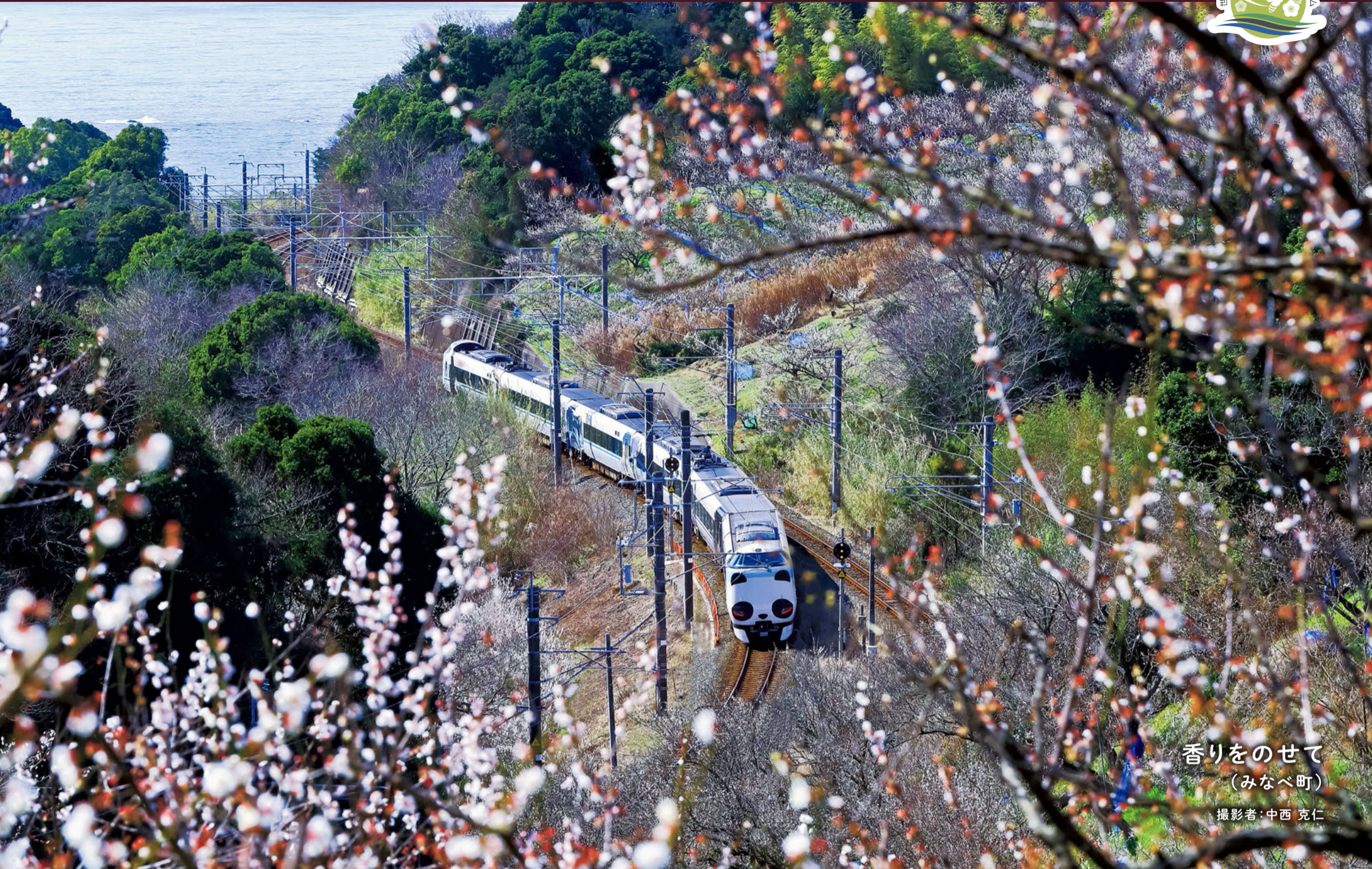
香りをのせて (みなべ町)