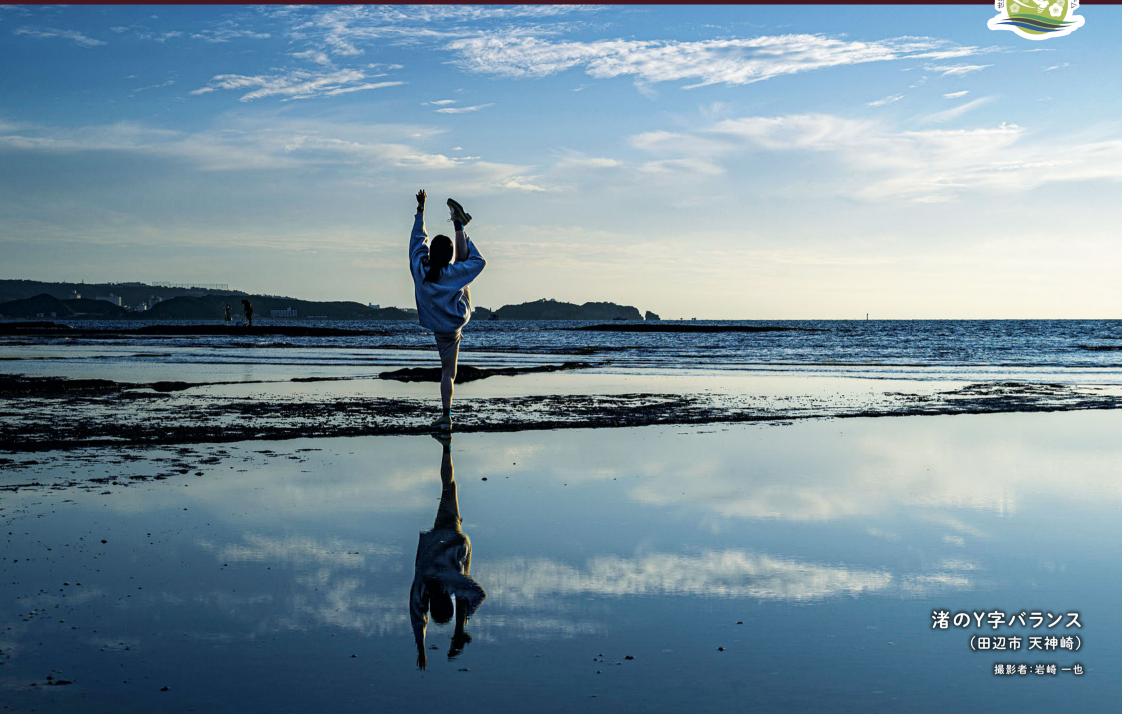
渚のY字バランス (田辺市 天神崎)