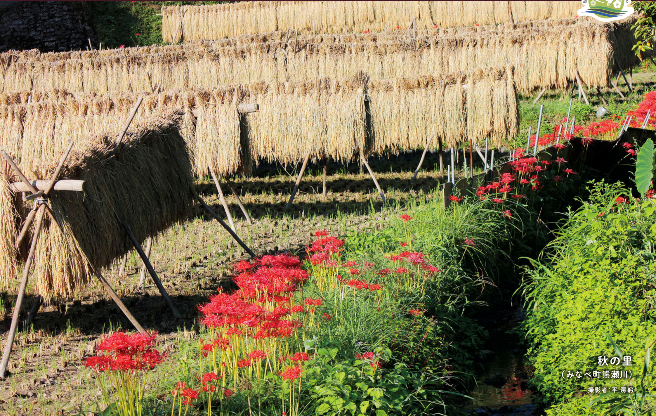
秋の里 (みなべ町熊瀬川)