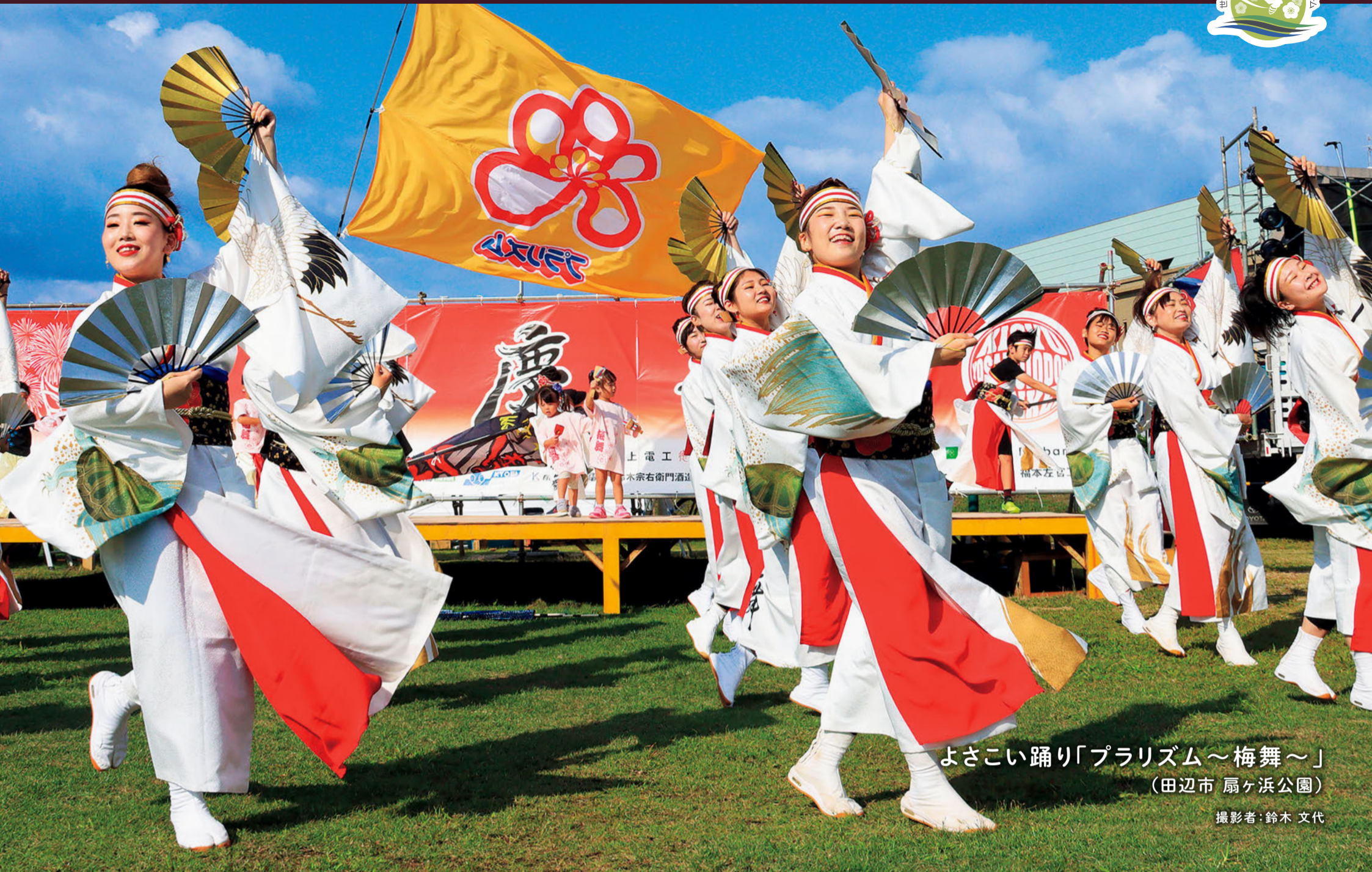
よさこい踊り「プラリズム～梅舞～」 (田辺市 扇ヶ浜公園)