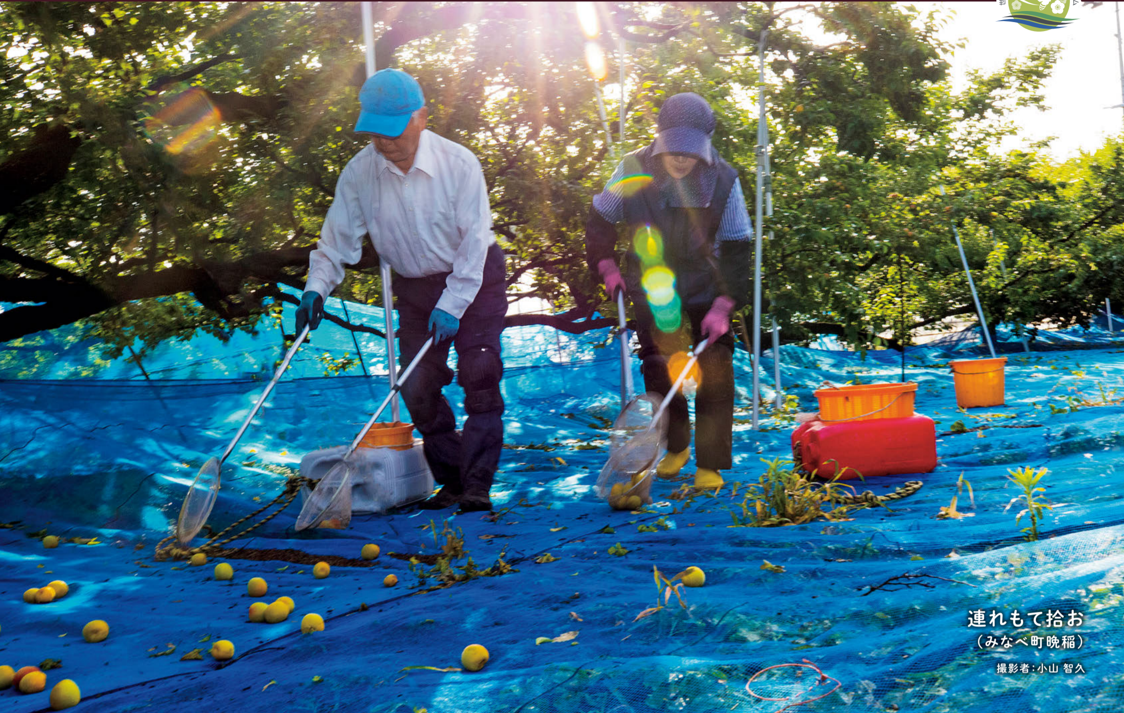
連れもて拾お (みなべ町晩稲)