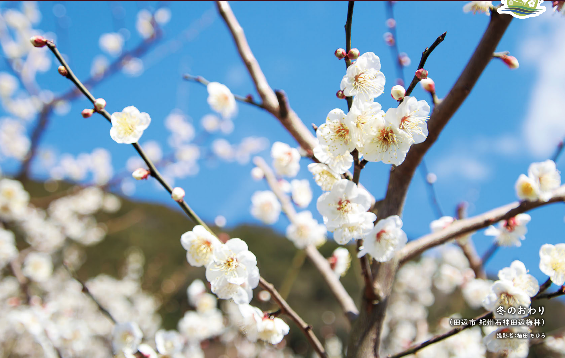
冬のおわり (田辺市 紀州石神田辺梅林)